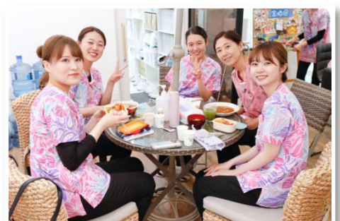
院内での楽しいランチの様子

楽しんでやる仕事と、仕方なくやる仕事では、人生の豊かさが変わると思います。新しい環境に飛び込むのは勇気のいることですが、楽しむ気持ちも忘れずに頑張ってください(*^-^*)