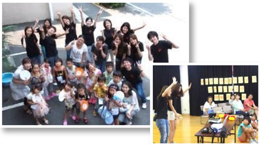
サマーフェスタの様様

夏祭りイベントや季節ごとの定例イベントなど、患者様に楽しんでもらえるイベントを年間を通じて開催しています！子供達の無垢な笑顔に触れる、患者様の心と一体となれる瞬間は、何事にも代え難いひとときです。