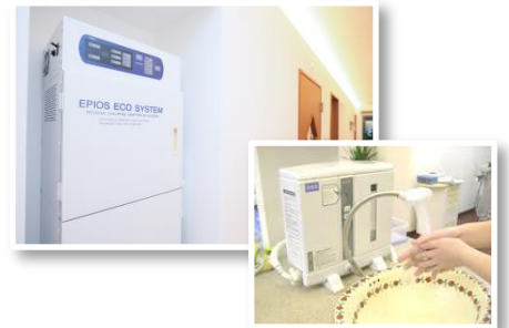
エコシステム（除菌水）

診療室全体で『エコシステム（除菌水）』を使用しており、ほとんど全ての細菌・ウィルスを除菌しています。患者様にとって安全で清潔な医院を実践していますので、 働く皆さんも安心して患者様に医療に従事できます 。