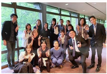
2年に一回の研究発表会

青山デンタルクリニックは患者様向けイベントはもちろん、スタッフ向けイベントが盛りだくさん！