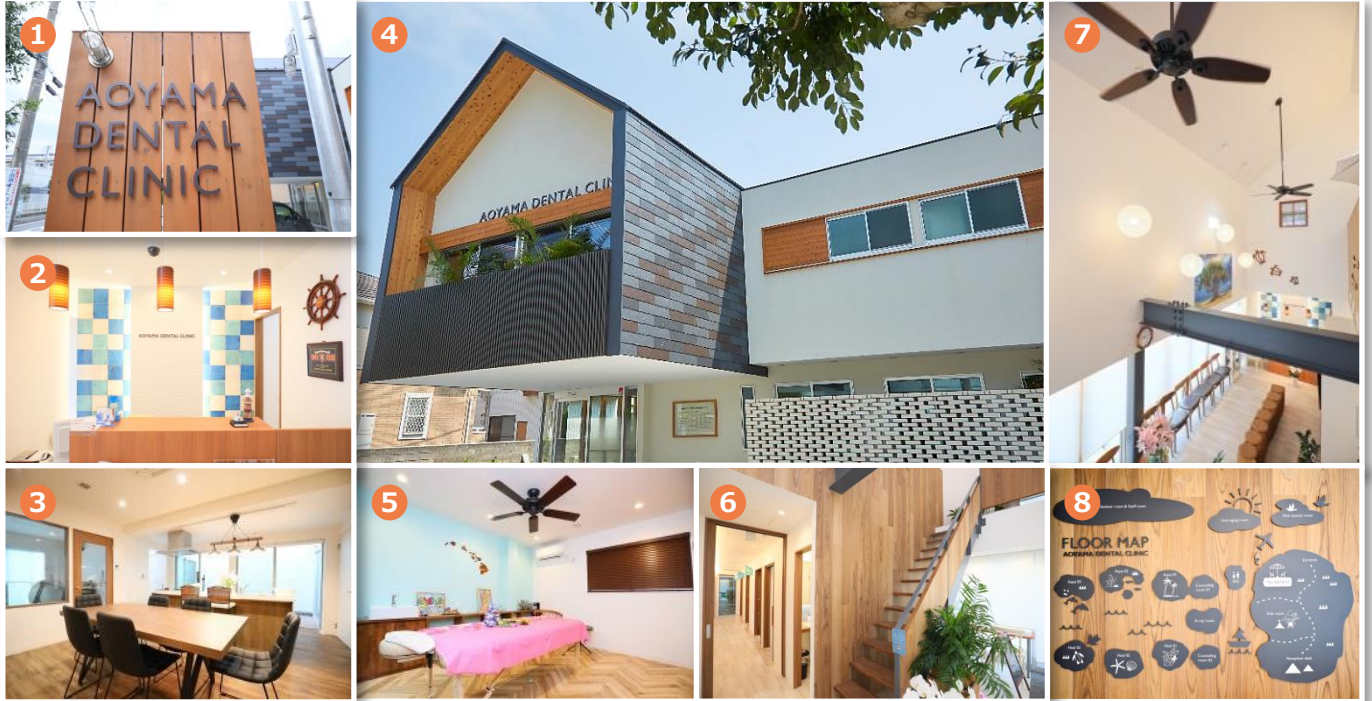
①医院看板、②受付、③ADCキッチン（飲食可能のマルチスペース）、④外観、⑤ロミロミ（ハワイの癒し技術）スペース、⑥2階特診室への階段スペース、⑦2階から見るロビー・カフェエリア、⑧院内マップ

「癒しとおもてなしのクリニック」を実現するため、様々な間づくりの工夫をしています。