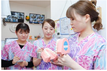
先輩スタッフによる新人教育（共育）

経験を積んだ歯科医師、衛生士、助手、受付が複数在籍しており、 しっかりとした教育（共育）、フォロー を行います。