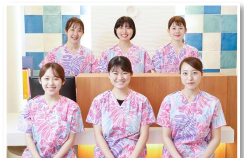
受付・歯科助手の皆さんと

入職当初、慣れない仕事に不安でいっぱいでしたが、青山デンタルクリニックには優しく指導して下さる先生や先輩が沢山いてすぐにお仕事が大好きになりました。仕事をしながら学ぶこともでき、スキルアップがやりがいにも繋がります。様々な歯科医院がありますが自分に合った環境で楽しくお仕事出来るような職場を選んでいただきたいです。