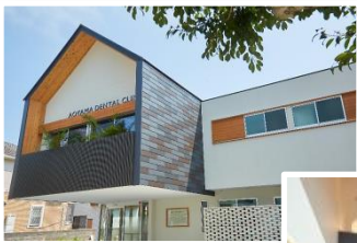
2019年に 移転リニューアル！